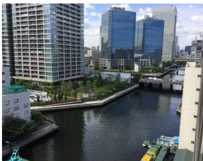
★ 日当たりが良いお部屋 ★